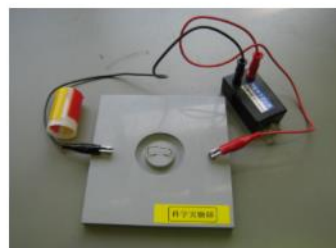
エタノールロケット