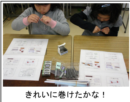
きれいに巻けたかな！

作り方は簡単だよ。まず、ストローにエナメル線を巻いてコイルを作ります。この中に鉄釘を通します。つぎに先ほど巻いたコイルに乾電池をつないで、電流を流すと釘が磁石になります。巻き方をくふうして強力な磁石を作って見よう。