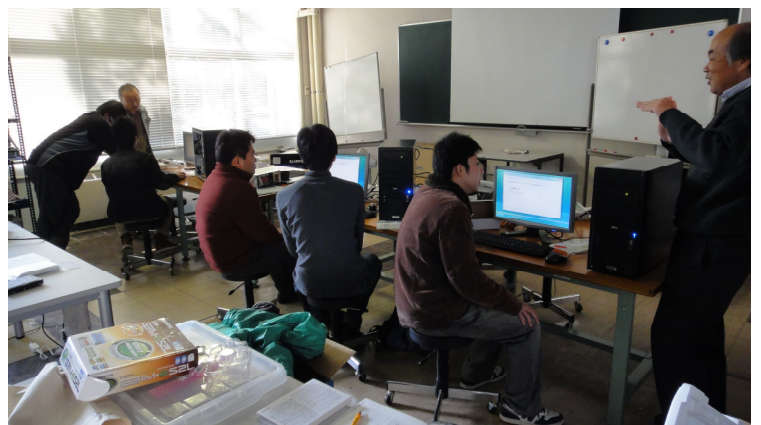
5. 完成後の質問タイム?!