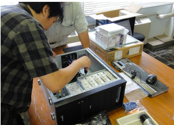
4. マザーボードの取り付け中