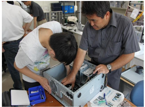
4. マザーボード配線