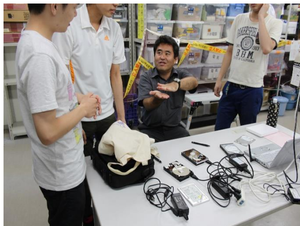
7. ハードディスク内部の解説