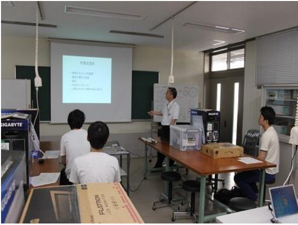
1. 組み立て前の解説